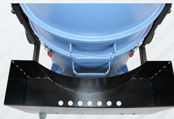
КОРЗИНА ДЛЯ НАСАДОК