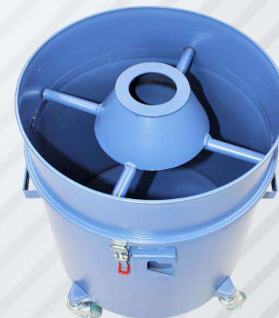
БАК-ЦИКЛОН НА 75 Л